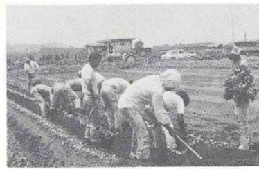
植付にはげむSAP会員

食用カンショを選んだ理由は、火山灰土壌に適していること、最近、宮崎県産味が良く市場で好評を受けて来ているため、畑作