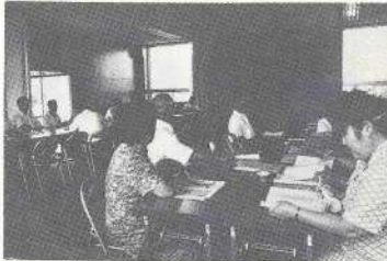
青少年問題を真剣に討議

夏休み期間中は、定期的な解放感から、とかく生活がルーズになることになり。三股町内の電話の普及率はここ二、三年の間に急速な伸びを示し、五十年三月末では人口一〇〇人当り二一・三人が電話を持ち、かつまた、世帯当り七一・五世帯に電話が