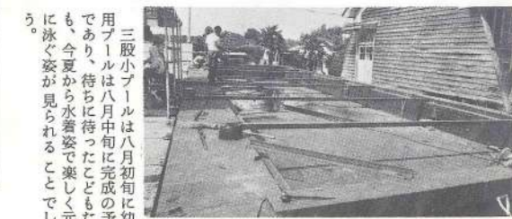
完成近い三股小プール

夏は、子どもたちが肌を麦いろにそめ、水しぶきをあげて時のたつとも忘れるほどに、はしゃぐ姿は健康で、スポーツの中で水泳が、最も魅力あるスポーツのようです。