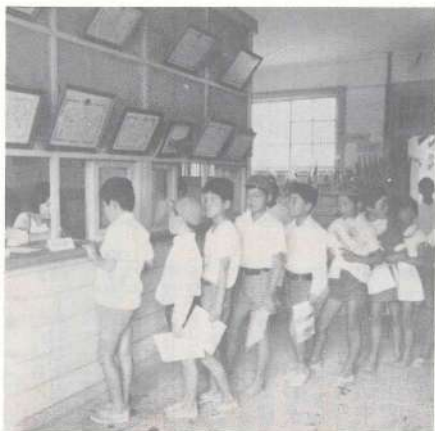
手帳もスムーズに通帳を片手に順番を待つ生徒達 —宮村小学校「こども郵便局」—