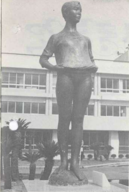
▲庁舎前に建立された健康像

民がしあわせと健康で文化的な明るい生活を営み、更に、生活環境の美化、浄化をはかることが基本的な要素であり、躍進と健康を象徴する町民の健康像として、自然と調和した南國的なデザインのもとに建立されています。