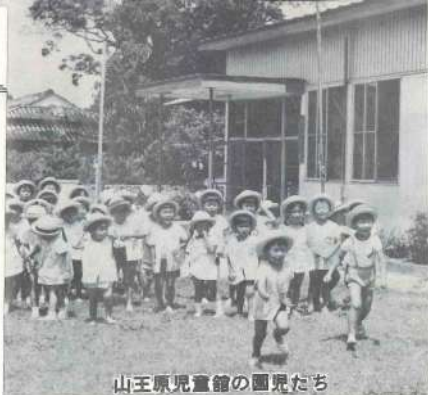
山王原児童館の園児たち