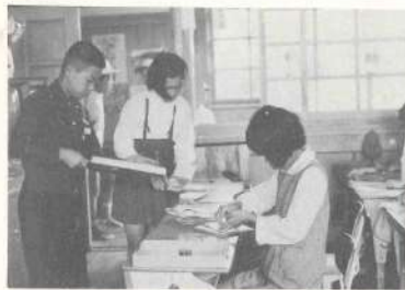
集計に精出す子ども郵便局員