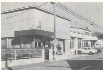
三股町農業協同組合全景

明けましてお出とご御座います。町民の皆さん方には大変お世話になり、順調な事業実績を納め、四十六年の新春を迎える事が出来