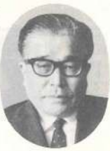
新年おめでとございます。

昭和四十六年の年頭にあたり、ついで町民の皆さまの御清福と御繁栄をお祈り申し上げます。