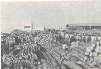
三股町森林組合木材共販市風景

新年おめでとうございませう。町民の皆様、日頃、森林組合の育成のため一方ならぬ御協力を賜わり心から感謝申し上げます。本年も亦、一面の御支援とご鞭撻をお願い申し上げます。御承知の通り、吾が国経済の発展に伴って木材需要は年々増加の一途をたどり過去昭和四十四年一、五三三(延)と昭和四十四年一、九、五五七(延)を比較しても、実に四、四〇〇万の差であり、この数字