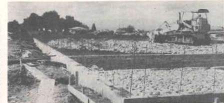
大和工業KK工事現場