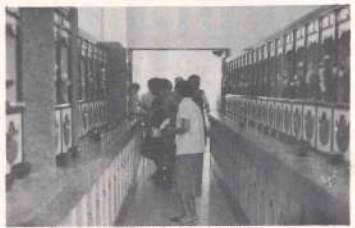
梶山納骨堂内部 (仏だん)

上の問題でもある故、ハエの発生源を遠放し、土葬もやめよう……と、旧来の墓地觀念から近代的な納骨堂と、町内全域に盛りだがり、昭和四三年に第二地区納骨堂が相模原をトップに、ついで豊池地区の蓮華堂が同年に完成、昭和四十四年には、第七地区納骨堂、植木納骨堂、三股中央堂の三つが完成、更に本年度は、すでに田上地区の仏向堂納骨堂が完成しており、この梶山納骨堂は七番目に落成したものです。 絶対の白地、長田天神原に建設された梶山納骨堂は、敷地面積一、八八五平方メートル、建物三三九、九平方メートル、総工事費一七、八〇〇円、扉は白とピンク色で調和されており、