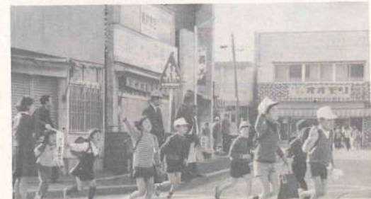
横断歩道は正しくわたしましょう