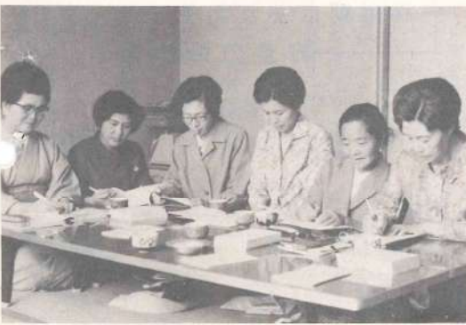
短歌づくりに余念がない会員たち

町短歌同好会は作品の文学的価値は別として、びたむきな心でわが郷土の昔をしのび現実を見つめ、明るい町づくりの一助として満足したのが昭和四十三年十一月、会員数三十名、若男女交えての小さなグループながら楽しいひとときを過ごしています。ここに過去一年有剰の作品集が発行されました。 作品集を手にして、心あたたまる秀作ぞろいで、二、三紹介しましょう。 なお、同好会では広く町民の同好の志を求めています。どしどし入会されることをおすすすめします。