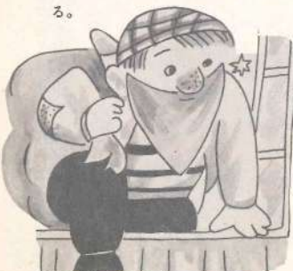
戸締りをしないと、窓から、へんなおじさんが入ってきます。