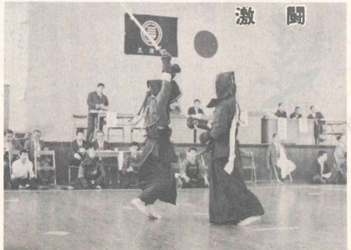
剣道大会 (於三股町体育館)