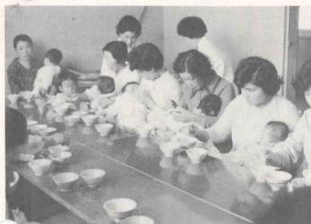
離乳食を与えるお母さんたち

あけくの果てには、目上の人に聞くといった始末、その答えがいつも正しいとは限りません。このような不安を取りのぞき健康な赤ちゃんに育てていただくために、毎月一回育児の指導を次の通り町では行なっています。 ●妊婦と乳児の検診 毎月第二水曜日町中央公民館で、妊婦と乳児の検診を。 ●離乳食の作り方・与え方 生後五ヶ月児には、正しい離乳食の作り方、与え方について毎月第四木曜日指導しています。 気軽なお出で下さい。な、その都度回覧板でもお知らせします。