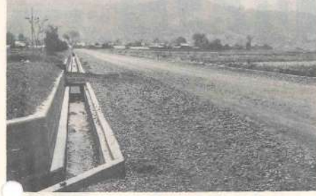
今年も道路整備は積極的に

昭和四十五年度の三股町の一般会計当初予算は五億七千万円前年度より一七・二%の増加をみております。