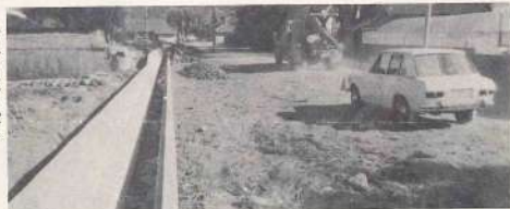
ぐんと広くなる 三股駅上米線

る都三線、都城北郷線として大いに利用されることでしよう。 すでに沿線附近には中村自動車学校、都城農業高校三股教場などがあり、この路線の整備が導火線となつて、この附近から都三線方面にかけて、その地理的、地形的好条件を利用して、飛躍的に発展するだろうと予想され、地域住民の期待も大きいようである。