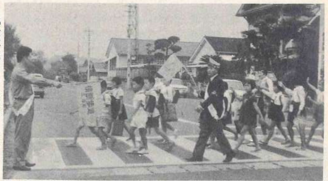
あなたもほくも交通ルールを