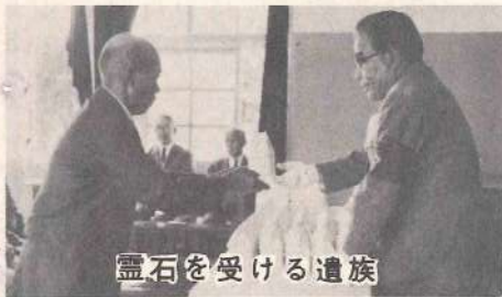
遺族に受け渡す霊石