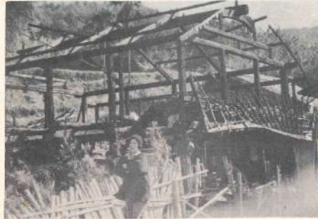
こうなつてからはおそすぎる

性が十分である。たばこが火災にまで発展するには時間がかかるため、油断しやすい。たばこは時と所を問はずよく吸われ、あつたれでおります。それではどうしてこの火が原因としたのか。この外酔つて火のついでたばこを吸つたのを忘れたとか、ゴミ箱に火のついたままのたばこを捨てたのが原因というのも多いので、このたばこの不始末による火事