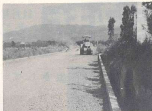
山王原早水線舗装工事現場

もあるというのであります。むしろさきでまればはなさないで、私たちに意外なじみがある、その税金もさかし高いだろうと考える人も多いと思ひます。 ところが譲渡所得には税金を安くする特別の方法がとられております。それは売った資産が三年をこえる期間所有していたものであれば半額課税といつて売渡したることによつて生じた利益の対象となります。ですから資産そのものの値上りを考えますと決して高い税金ではありません。 また現在住んでいる土地や家を売つて、同じく住宅用として別の土地や家を買いかえた場合にも、手続きをすれば、税金がからなくなつたり、また特にお安く済むといったメリット、いろいろ有利な取扱いがあります。 なおくわしいことは税務署が町税務課に相談された方がよいでしょう。