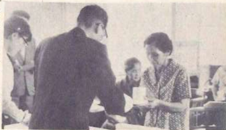
霊石を受取る遺族

今は亡き夫の、肉親の遠いありし日の面影を胸にえがいて、高さ七・五センチメートル、横五・五センチメートルの白木の箱に納められた霊石を、あらためてこみあげる悲しみをおさえて