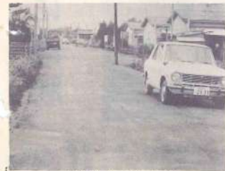
どの道もこんなに

三股町側は二十一キロメートルありますが着々改良舗装化がすす、昭和四十五年度までには大野まで完全舗装化が予定されており