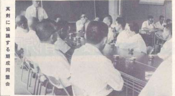
真剣に協議する期成同盟会

合し、整備促進協議会を開設しました。 先ず両町による期成同盟会を結成する宣言がなされ、そして「県道・都城北郷線は都城と日南市を結ぶ主要