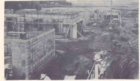
建設中の勝岡宮下団地

今年度の建設場所は昨年同様勝岡宮下団地です。今年度の建設場所は昨年同様勝岡宮下団地です。