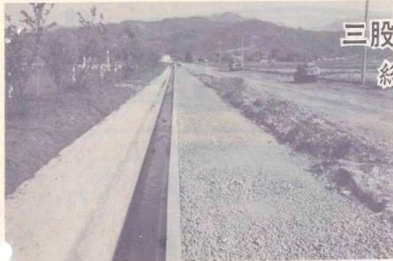
道路の整備は今年も積極的に