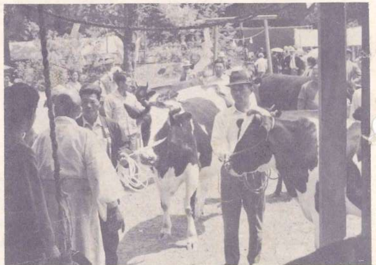
自慢の愛牛とともに

さすがに牛馬の神様とあって家畜の無病息 災と一家の繁栄を願って牛を引き連れてのお 参りが人目をひいておりました。