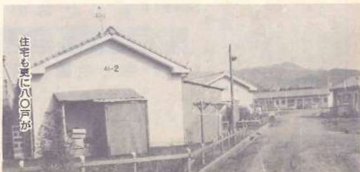
住宅も更に八〇戸が

このようにして私たちの町は苦しい財政状況の中にあって、いよいよ美しい住みよい福祉の町を築こうと意気込んでおります。 それではこれをまかなう財源は、どんなふうに入ってくるか、入面をながめてみましょう。 私たちが直接納める固定資産税、町民税などの町税は全体の一五%、五千七百万円が見込まれております。しかしなんとこの町税の一番多いのは財産税の少ない町村に交付する地方交付