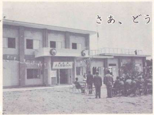
装いも成って、招く、老人福祉センター

「おとしよりにもっと喜んでほしい」という願いは皆同じですが、町においては「おとしよりにいては、この場所を」を大きくかかすためであり、その一つ老人福祉センターが完成しました。 社センターがこのほど完成し、五月一日はなばなく開園いたしました。 敷地面積八九九坪、工事費一、三〇〇万円、建坪一六坪、延一五二坪の鉄筋二階建、うすむらさきのモダンな建物の周囲の美しいグリーンの田園にマッチして老人福祉を象徴するかの