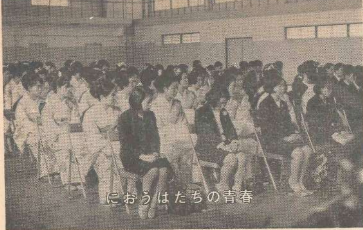
青春の私たちのうら

卒業、進学、就職などをひかえたお子さんのある家庭では、それぞれの準備や心構えができていることと、思います。 一番大切なことは、家族全部が暖かい気持ちで見守つてやることです。