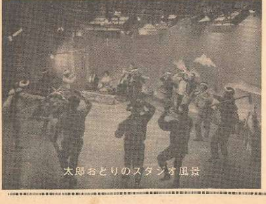
太郎おどりのスタジオ風景

おもむき、午前午前にわたって何回となく行われた、前リハールに汗だく、ようやく午届四時頃の本番にはもうたくたたる程の熱演でした。 そのかいあって翌一日の放送は金座下の人々が、