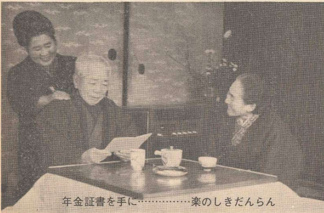
年金証書を手にとる………楽のしきだんらん

厚生年金や各種の共済組合など、いろいろな年金制度がありますが、このうちいくつかの制度をうつりかわる八のために、それらの制度に加入していた期間のすべてをつないで通算老令年金が支給される仕組みになっております。