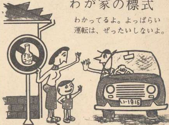
寒い時期の安全運転