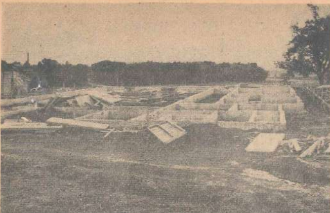
第三地区公民館建設現場

構造は軽量鉄骨造り、平屋建て、内部は学級室、集会室、会議室、図書室、調理室、事務室、管理人室等諸施設の完備したもので、近代建築の粋をこらして設