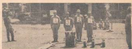
分 隔 は 充 気