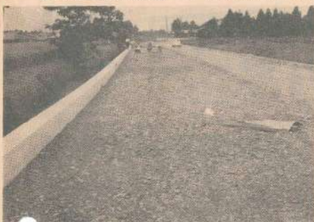
植木地区舗装完成はもうすぐ

本町を縦走る都城北郷線は都城木口町市をつなぐ重要な産業幹線道路として重視され、先に主要地方道に認定されて、その改良舗装も着々進められつつあります。 その拡充整備への進行度合いと比例して地域産業開発に貢献する事業効果も急速に伸びることでしよう。 本年度は特に事業費も増額され、すでに一部その工