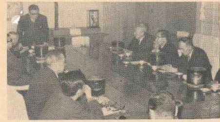
懇談会スームズに