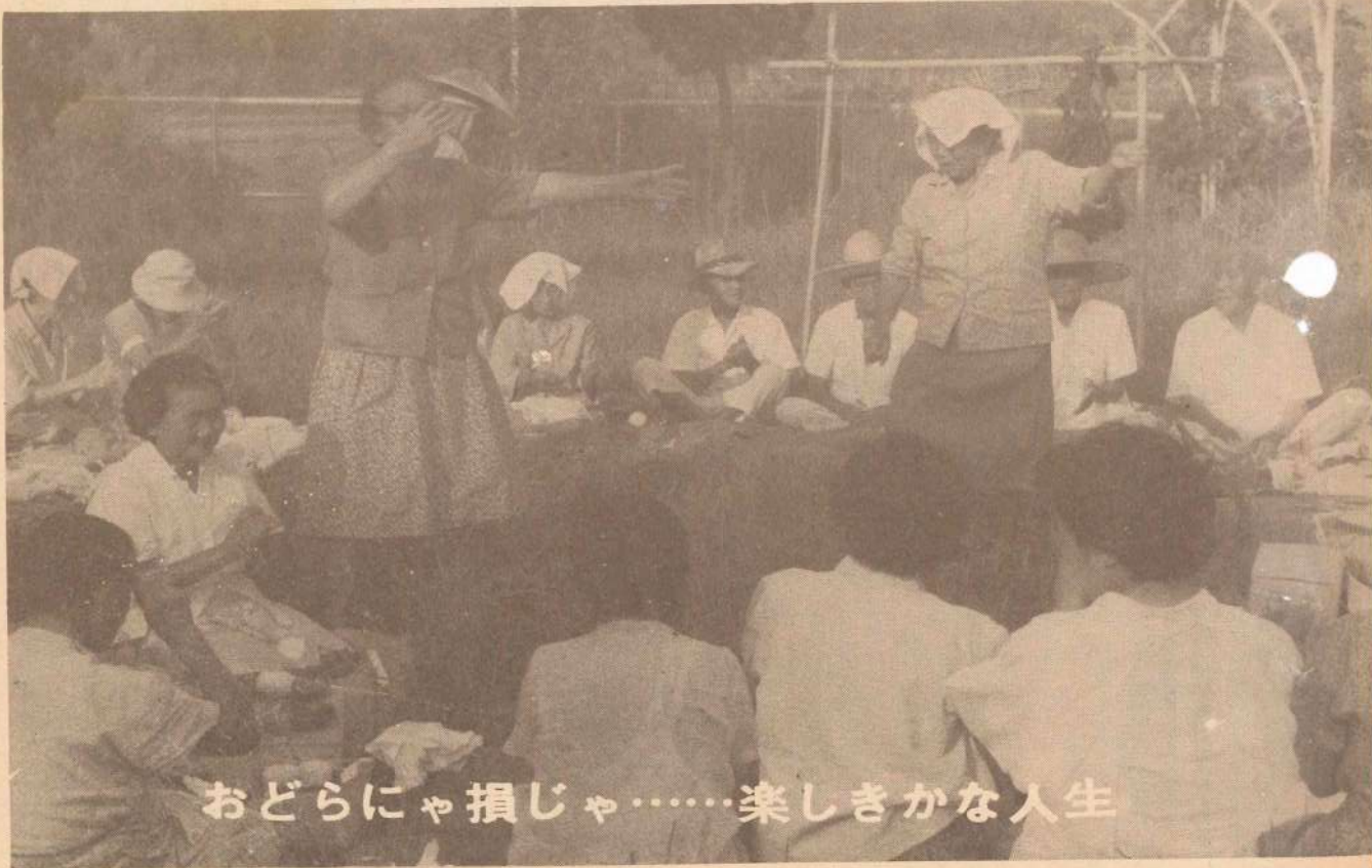
おどらにゃ損じゃ……楽しきかな人生