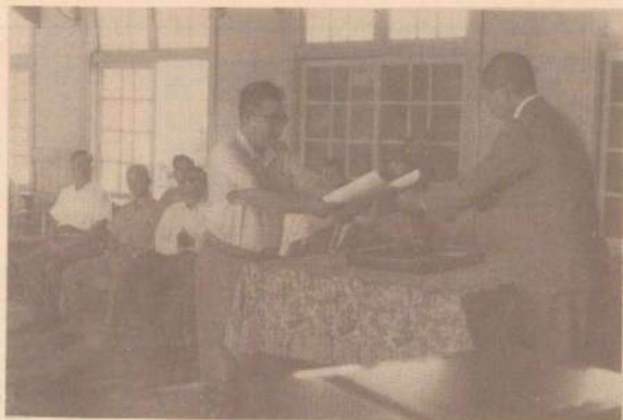
当選証書の交付を受ける町長

町民の幸せの為に新鮮にして、積極的な施策を打立て、躍進三股の建設に全力を傾倒したい