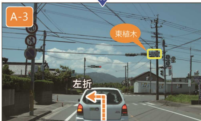
県道 108 号線（途中から県道 12 号線※）を約 4km 直進し、【東植木】交差点を左折します。川を渡って 3 つ目の信号です。