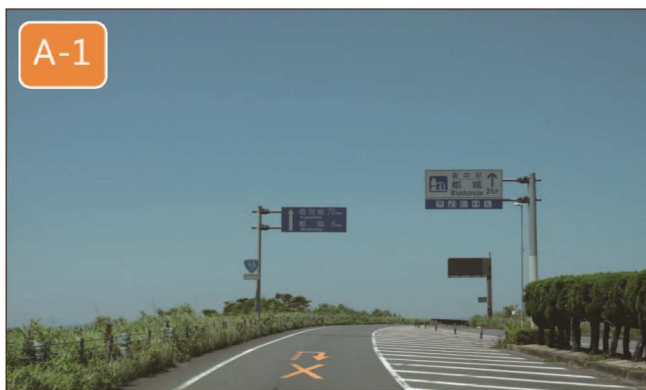
都城 IC 料金所から、左レーンの【都城】方面に進むと、国道 10 号線に接続します。

発行 みまたモノづくりフェア実行委員会事務局 〒 889-1995 宮崎県北諸県郡三股町五本松 1-1 三股町役場企画商工課 企画商工係内 TEL 0986-52-9085