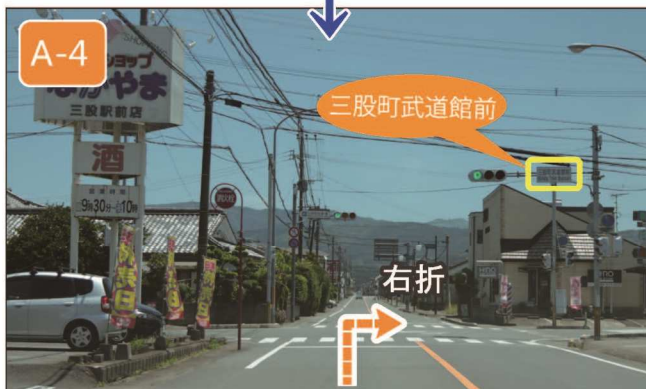
【東植木】交差点左折から約 1km 直進すると、【三股町武道館前】交差点右手に会場があります。