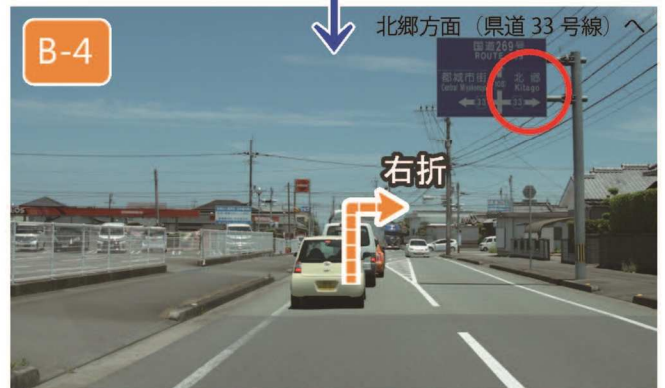
【宮村】交差点左折から約1km直進し【西植木】交差点を右折（※）、北郷方面へ県道33号線を進みます。