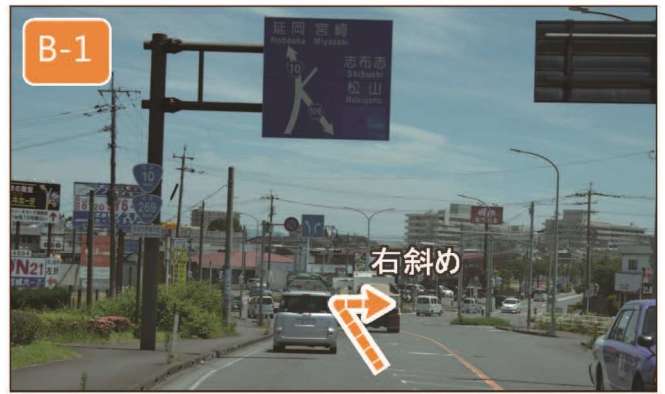
国道10号線から【甲斐元】交差点を右斜めに進みます。目印は交差点手前右の「神田川」。

発行 みまたモノづくりフェア実行委員会事務局 〒889-1995 宮崎県北諸県郡三股町五本松1-1 三股町役場 企画商工課 企画商工係内 TEL 0986-52-9085