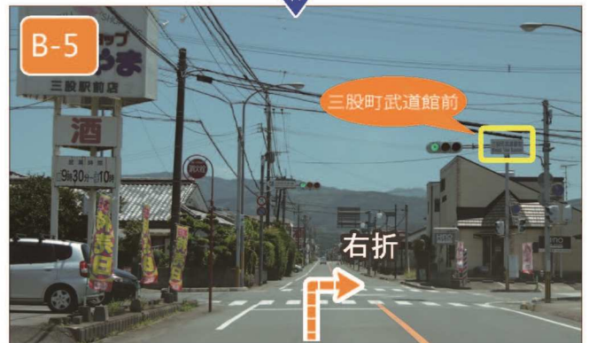
【西植木】交差点右折から約2km直進すると、【三股町武道館前】交差点右手に会場があります。