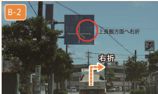
甲斐元交差点から約500m進むと上写真の看板が出てきますので、交差点を右折します（上長飯方面へ）。