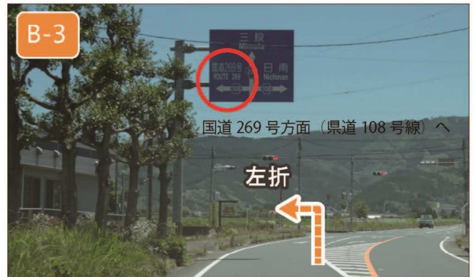
約4km直進し（途中、イオン都城が左手に出てきます）、【宮村】交差点を左折します（国道269号線方面・県道108号線へ）。