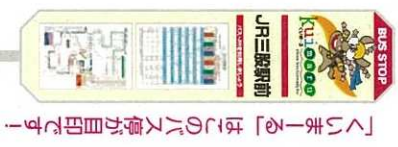
「くいまーる」はこのバス停が目印です！

平成26年11月1日より、路線・時刻の一部が変更になります。ご利用の際は、掲載の時刻表をよくご覧ください。